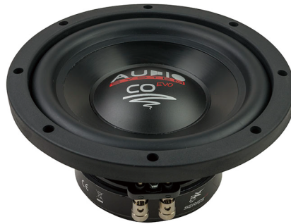
CO 08 DC